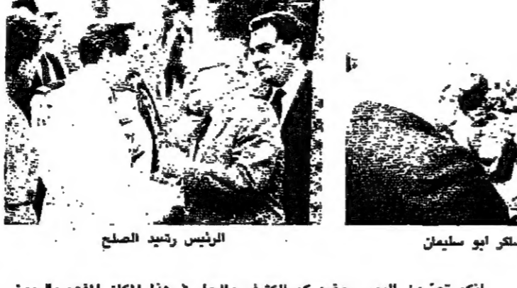
الوزير رشيد الصلح